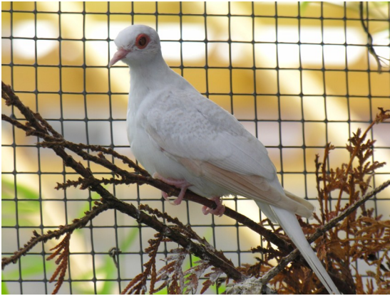
Colombe Diamant brillante