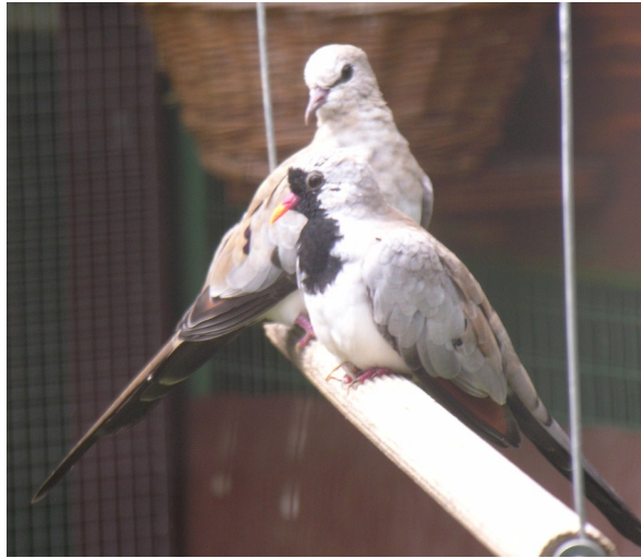
Colombe Masque de Fer