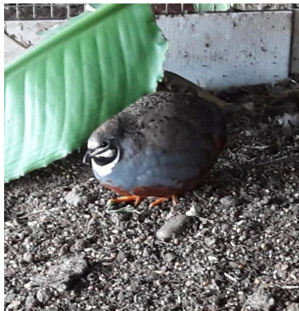
Caille de Chine