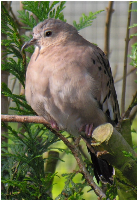
Colombe de Buckley